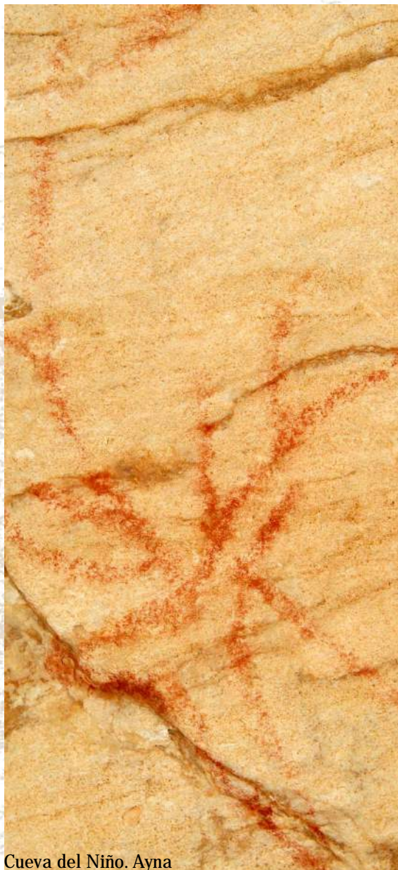
Cueva del Niño. Ayna

Desde que a principios del pasado siglo se descubrieran las cuevas de Alpera hasta hoy, con el reciente descubrimiento de un abrigo con arte rupestre en la zona de Minateda, ha pasado mucho tiempo y nuestro arte rupestre ha supuesto un elemento de reflexión para la ciencia prehistórica y para el estudio de los orígenes del arte. En la actualidad se trabaja con las más modernas tecnologías para comprender mejor su técnica, el estilo, su cronología, el sentido profundo de este arte, su estado de conservación, su futuro, la delicadeza de sus formas, la complejidad de sus escenas y el poder del beneficio del Patrimonio Histórico como una fuerza para producir riqueza.