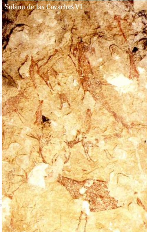
Solana de las Covachas VI

La viveza y el movimiento, la oblicuidad, la simplicidad y la economía de formas, son elementos que definen y otorgan este carácter especial a un tipo de arte rupestre prehistórico que muy bien pudiera tener sus referentes en las magníficas representaciones animalísticas de finales del Paleolítico Superior. Las escenas nos relatan situaciones muy variadas y complejas de definir. Hombres al acecho o cazando, grupos humanos guerreando, fiestas o celebraciones rituales, mujeres danzadoras o recolectoras. Existe una notable y evidente dificultad a la hora de aproximarnos a la compleja mentalidad primitiva. Ello hace que frente al aparente corpus homogéneo