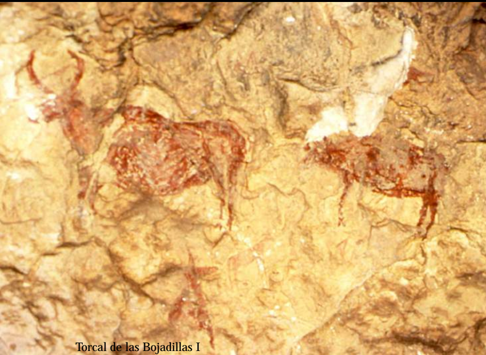
Torcal de las Bojadillas I