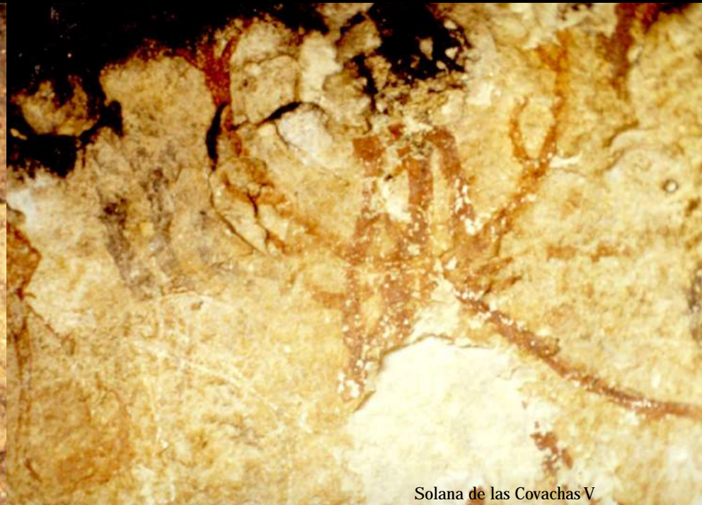
Solana de las Covachas V

A pesar de su extrema fragilidad y vulnerabilidad, estas manifestaciones culturales han perdurado casi milagrosamente hasta nuestros días. Hoy más que nunca corren un serio peligro.