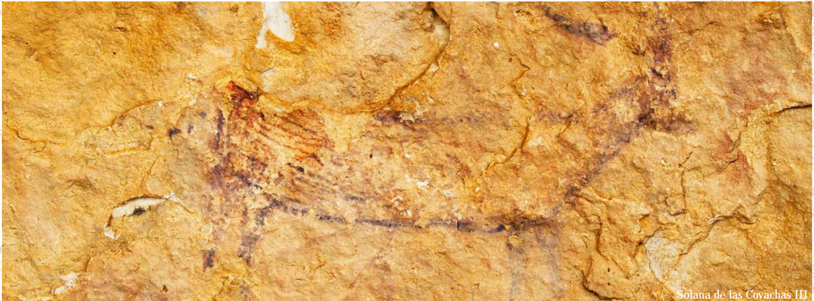
Solana de las Covachas III

Desde sus orígenes, la humanidad ha sentido la necesidad de transmitir, de plasmar sus creencias, sus ideas, los ritos o las costumbres de su cultura. Posiblemente la pintura sea una de las formas más antiguas y continuada de expresar como las sucesivas culturas y sociedades han vivido y entendido su propia realidad. Muchos investigadores opinan que el arte rupestre puede estar relacionado con prácticas mágicas, religiosas o espirituales, y que se realizaban para propiciar la fertilidad, una caza segura, la derrota de los enemigos, o quizás la señalización del territorio al que se pertenecía, lo que supone que su significado va mucho más allá de una expresión artística. Salomón Reinach comenta que el “artista prehistórico” no tuvo ninguna intención de agradar o complacer, ni de sorprender, sino que su intención era “evocar” a través de sus pinturas, y así éstas se convertían en un auxiliar mágico del hombre para