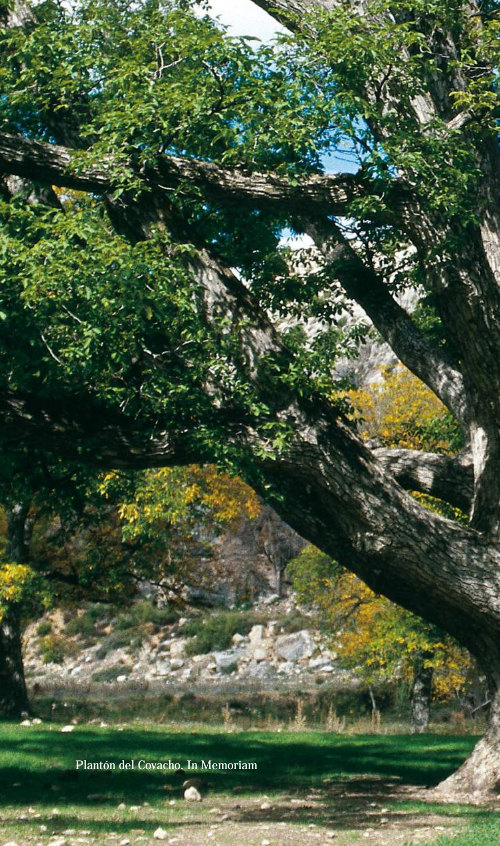
Plantón del Covacho. In Memoriam